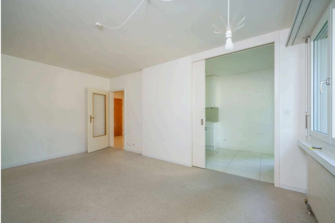
ein leerer Raum in einem Haus mit einem großen Fenster