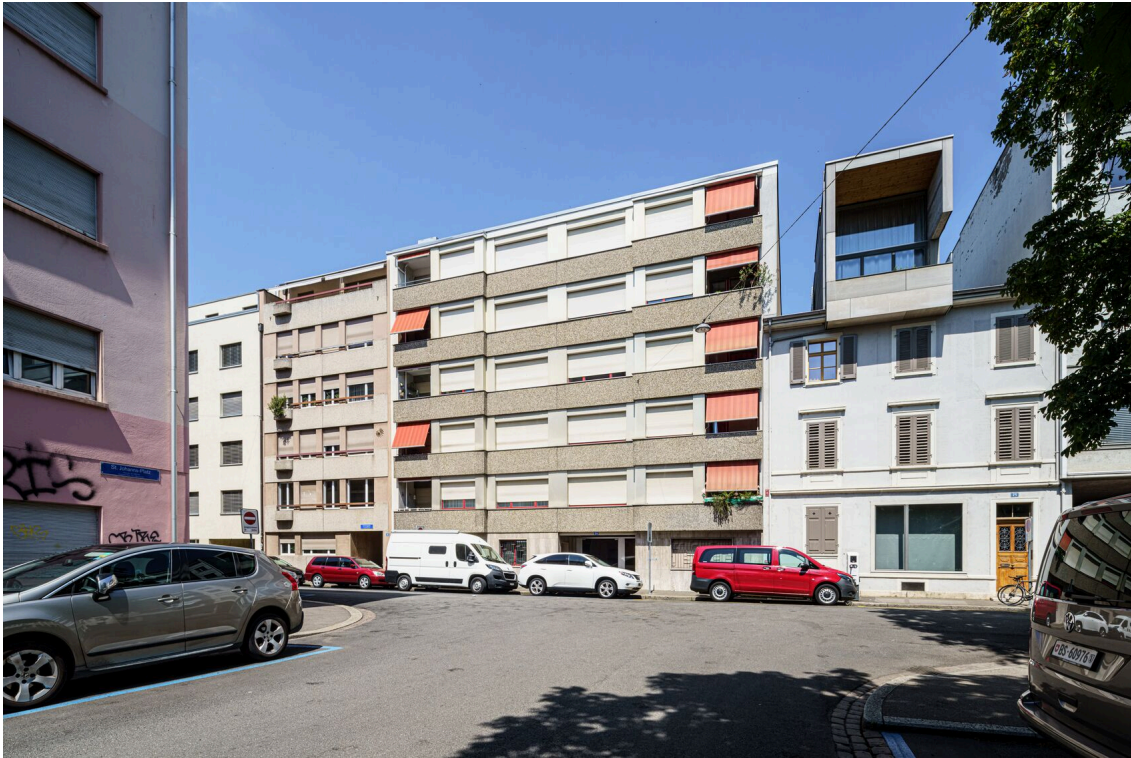
Autos, die auf der Straße vor den Mehrfamilienhäusern geparkt sind