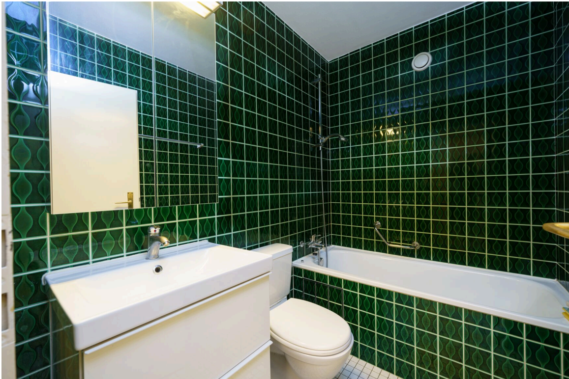
ein Badezimmer mit grünen Fliesen an den Wänden und einem weißen Waschbecken und einer weißen Badewanne