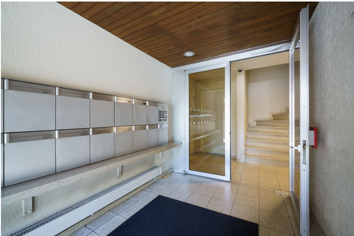
eine moderne Wohnung mit einem Flur und großen Schiebetüren