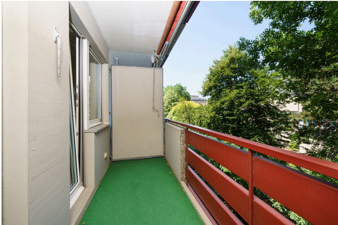
der Balkon einer Mietwohnung