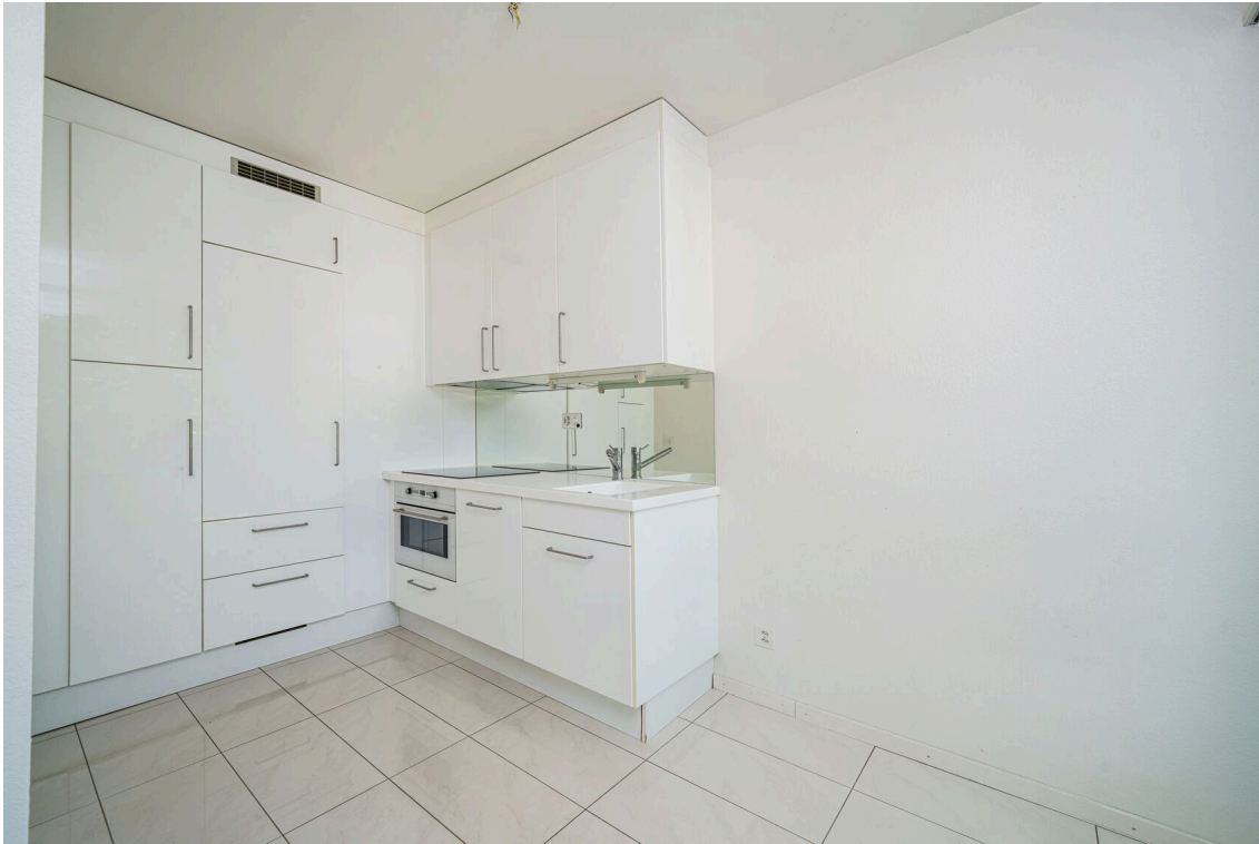
eine leere Küche mit weißen Wänden, weißen Schränken und weißen Geräten