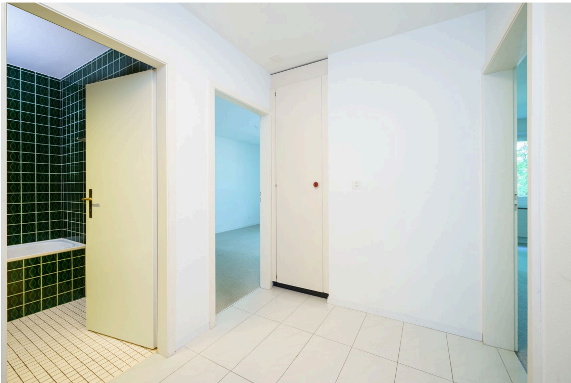
ein Badezimmer mit grünen Fliesen an den Wänden und einer weißen Dusche mit offener Tür