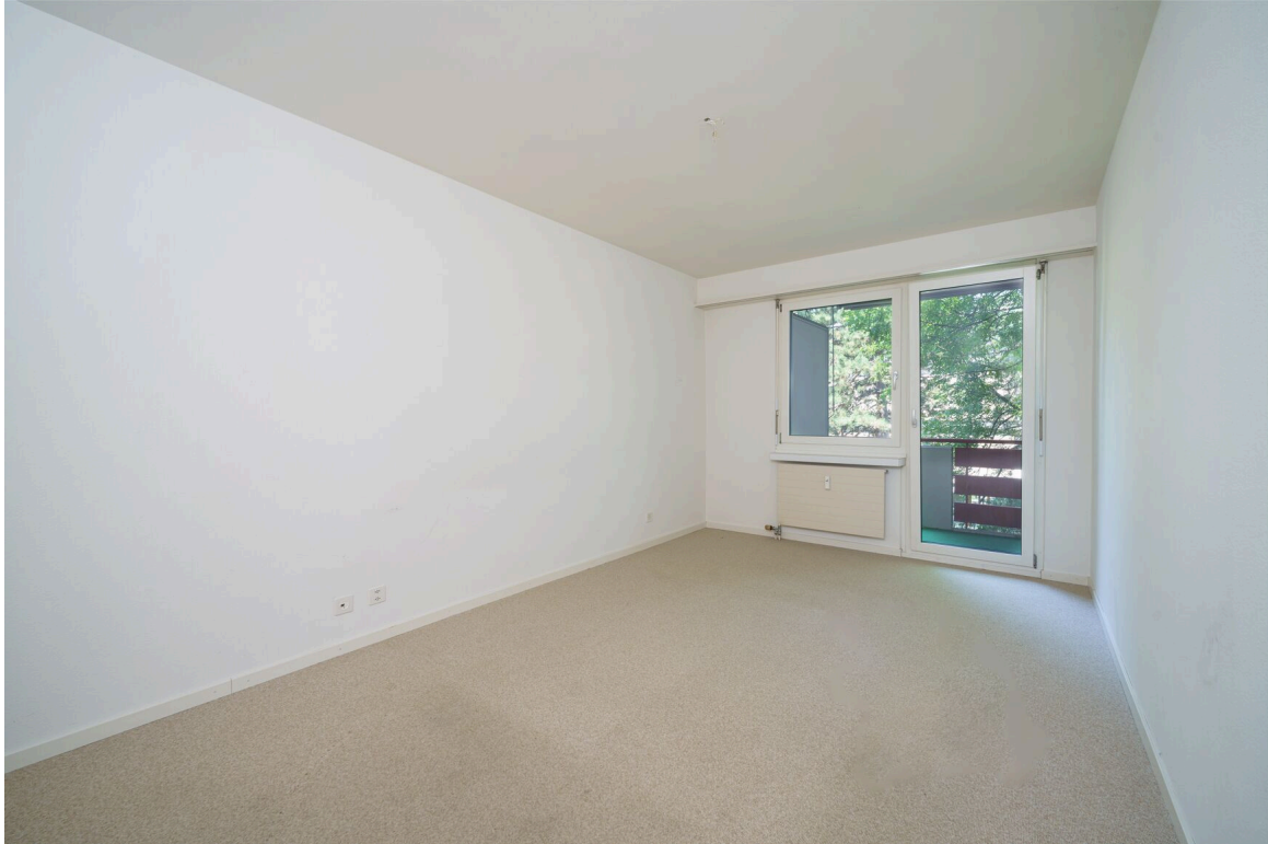
ein leerer Raum mit weißen Wänden und einem großen Fenster