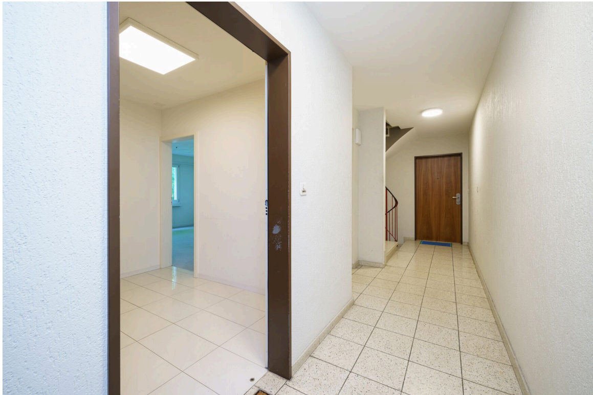
ein leerer Flur mit weißen Wänden und Fliesenboden