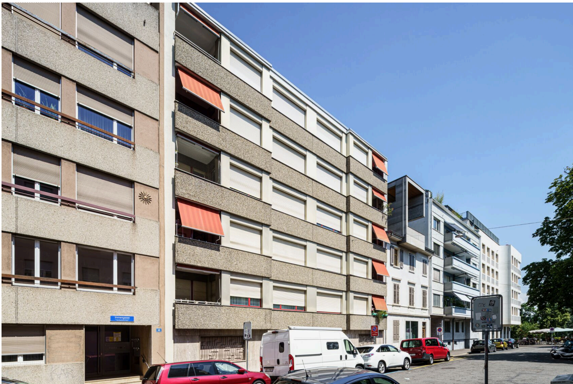
Autos, die auf einem Parkplatz vor einem Wohnhaus stehen