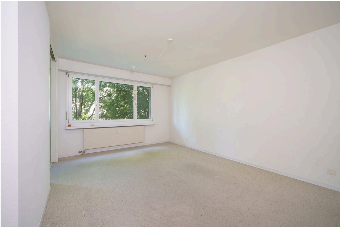
ein leerer Raum mit weißen Wänden und einem großen Fenster